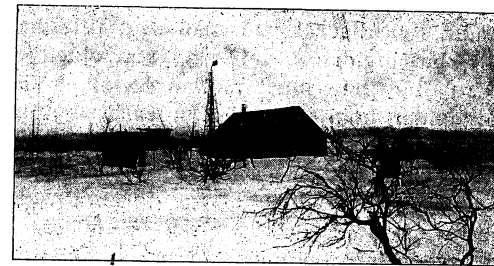
OBSERVATORIET VID vårvintern 1917. PÅREK 710 M Ö. H.

Vad som sedan skedde kan lämpligen hämtas ur ett brev från Hofling till undertecknad, skrivet dagen innan och möjligen delvis även samma dag han begav sig ut på sin sista färd i livet. Han skriver om den vidare färden till Pårek följande: »Tyckte jag höll så säkert efter rätta vägen men måste ha